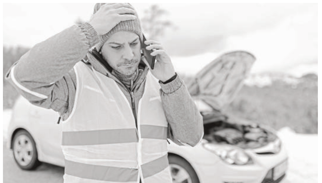
Eine Panne unterwegs ist immer ärgerlich. Mit einem regelmäßigen Batteriecheck können Autofahrer vielen Defekten vorbeugen.

Wir kümmern uns! Inh. Horst-Dieter Tödter