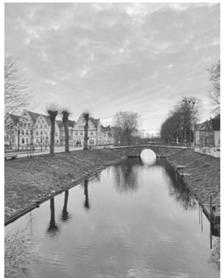
Ein schönes Foto von der Gracht am Markt.