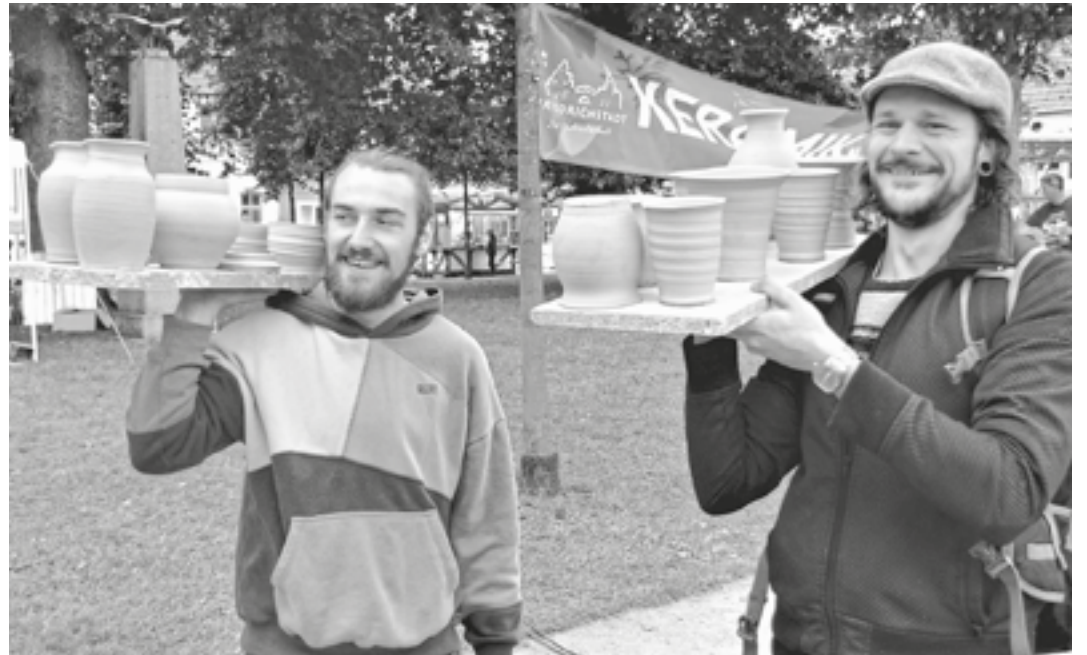
Auszubildende des Keramikhandwerks tragen frischgedrehte Keramikstücke vom Grünen Markt in die Werkstatt.

Mehr als wettgemacht haben diese Unterbesetzung die Auszubildenden im Keramikhandwerk Nord, die mit ihrer Berufsschulklasse und ihrer Lehrerin