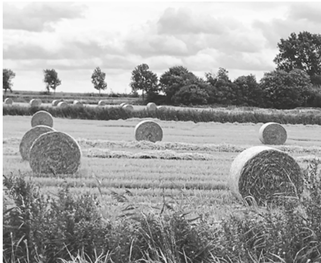
Spätsommer in Nordfriesland.

(rd) Was versteckt sich hinter den Einstellungen für das Smartphone, wie richte ich eine kostenlose E-Mail-Adresse ein, Whats-APP, Google u.a. Skype, Facebook. 25.-29.10.21, 10 bis 11.30 Uhr, 5 x Woche, Mo.-Fr., Rathaus, Am Markt 11, Kosten: 60 Euro. VHS Friedrichstadt, Am Markt 11, 25840 Friedrichstadt, Tel. 04881-990-40.