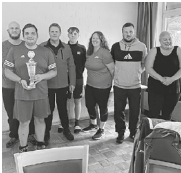
Die Siegermannschaft BV Kotzenbüll.