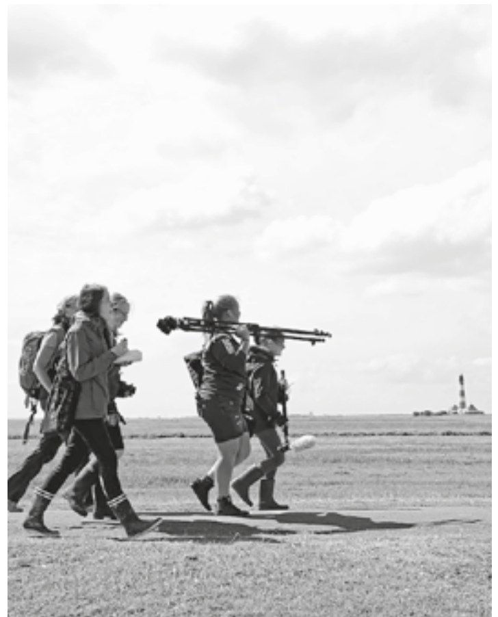
Ein junges Filmteam auf dem Weg zu Dreharbeiten.