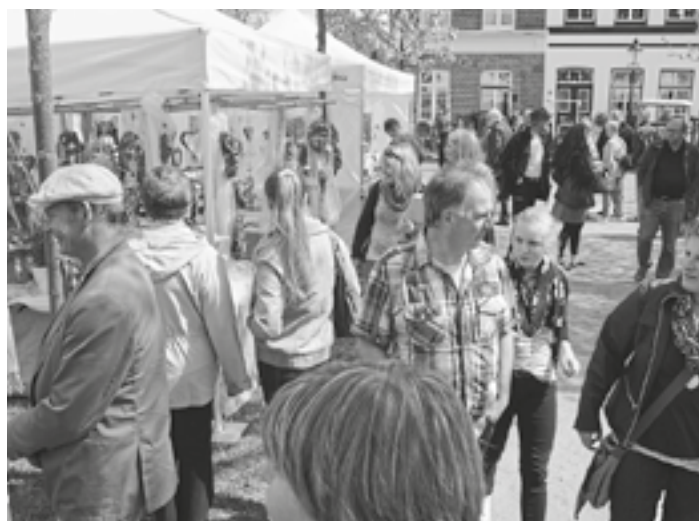
Köstlichkeiten aus dem Hofladen, Selbstgemachtes und Kunsthandwerker sind u. a. mit dabei.