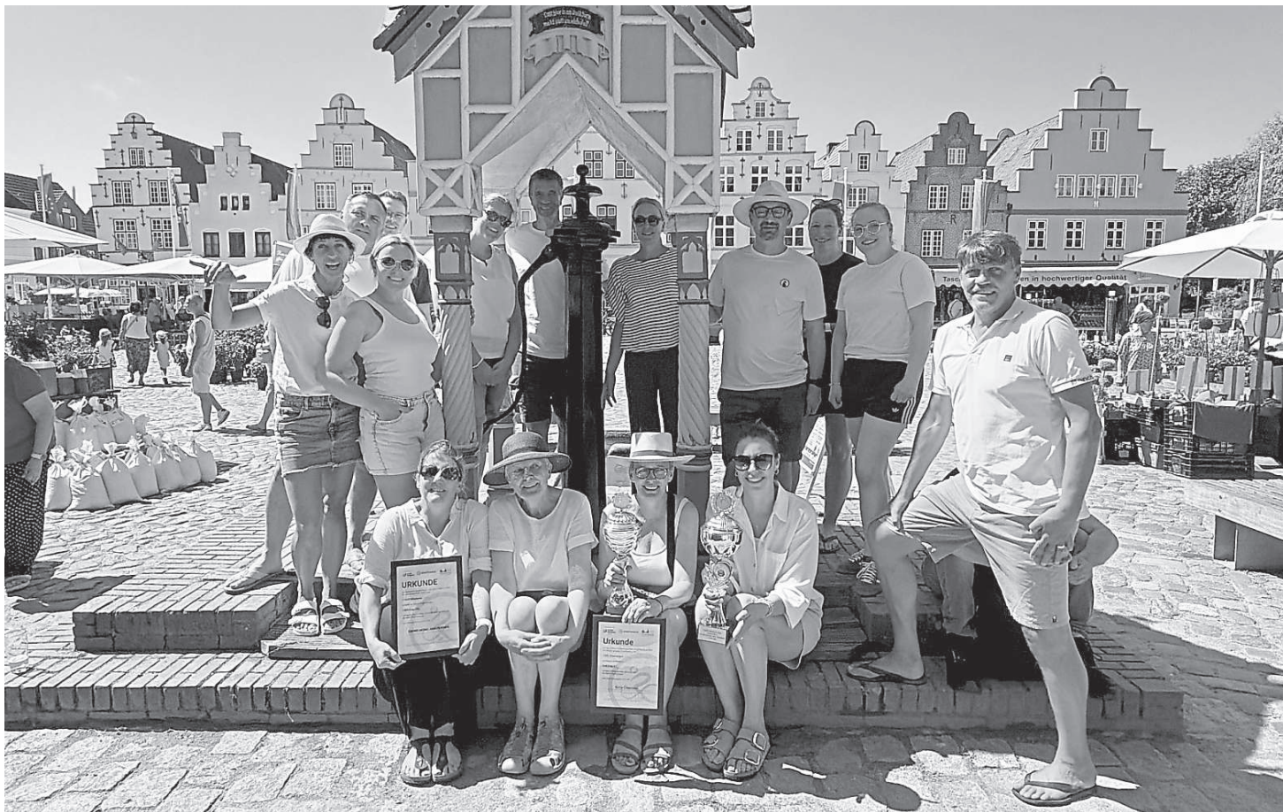
Team „Biking Moms and friends“ sicherte sich den ersten Platz beim Stadtradeln 2026.